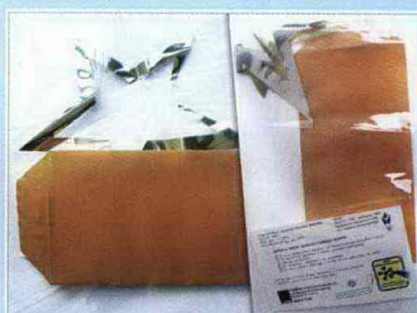
Mistrzostwo na Wielką Skalę - POLFRANS