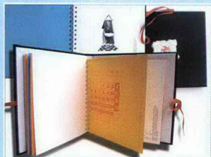
Mistrzostwo na Wielką Skalę - Międzynarodowe Targi Gdańskie