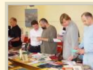
Obrady jury - kliknij aby powiększyć Cezex

W nadesłanych pracach jurorzy doszukiwali się przede wszystkim obsesji w temacie papieru, a także spójności kreacji z dobranym papierem. W tym roku jury było niezwykle zgodne i prawie jednomyślnie przyznawało nagrody w poszczególnych kategoriach. Zdecydowano również o przyznaniu nagrody specjalnej Jury oraz wyróżnienia.